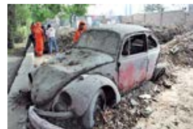
Así encontró el Estadio Municipal, abandonado, sucio y era almacén de chatarra y vehículos viejos.