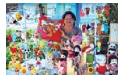
"Feria Emprendedores de Oro", un espacio que pone en valor el talento local y fomenta el emprendimiento de los adultos mayores del CIAM.