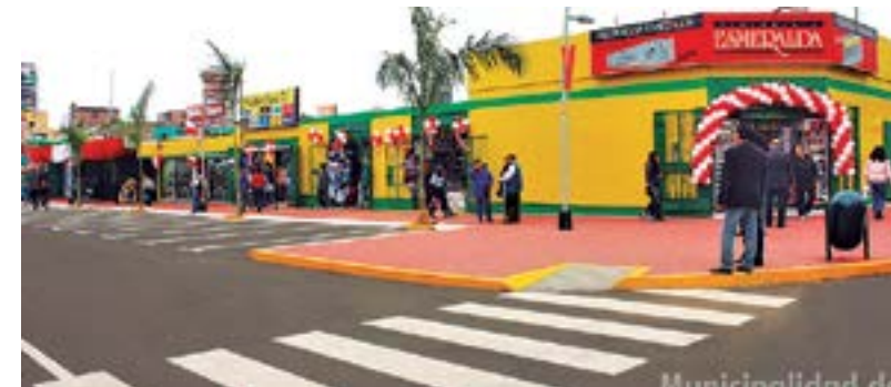
El Mercado N° 2 de Surquillo, en un trabajo conjunto con los comerciantes, se logró convertir en un Mercado Modelo, sin necesidad de cerrar el mercado.