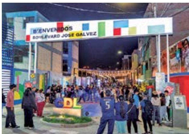
Arquitectura moderna como en las mejores ciudades del mundo.

moderno, seguro y ordenado para vecinos y transeúntes. Asimismo, el nuevo bulvar fue diseñado como un espacio accesible que promueve el uso ordenado del espacio