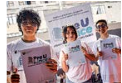
Pre U Lince 2026, viene beneficiando a estudiantes de secundaria.