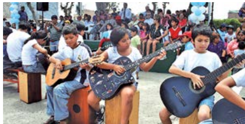
En lo Preventivo, para tener ciudadanos de bien, continuará apoyando la educación, el deporte, promoviendo la cultura y dando alimentación a los escolares en los colegios, haciendo cursos de reforzamiento escolar y promoviendo el programa municipal denominado PILAS, que fue creado en su gestión.