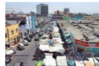
Así encontró el Mercado N° 2 de Surquillo, desordenado y descuidado.