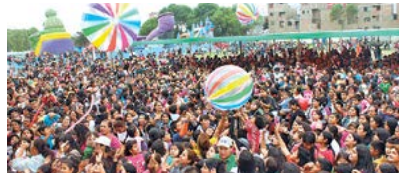
Continuará con eventos masivos para las familias.