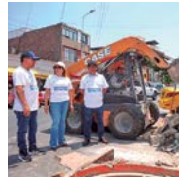
Mejorando el ornato con obras descentralizadas.

La entidad edil se consolidó como el municipio más efectivo de Lima Centro en la recaudación del Impuesto Predial, al alcanzar una efectividad del 99.6 %, según cifras oficiales registradas en la Consulta Amigable