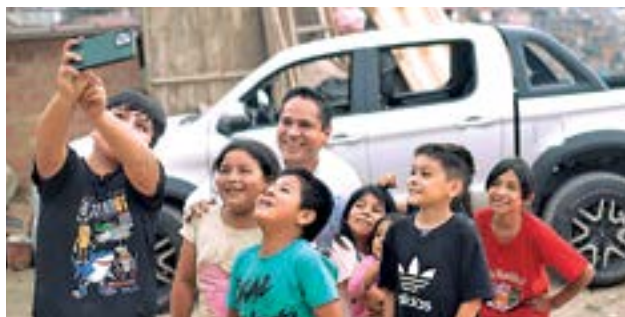
Apoyando el desarrollo de los niños, jóvenes y familias, priorizando la alimentación, la educación y la salud.

Encuesta realizada del 20 al 24 de enero del 2026, por CIT Opinión & Mercado.