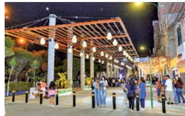
Vecinos y visitantes disfrutan de los atractivos paisajistas que rodean al Bulevar.