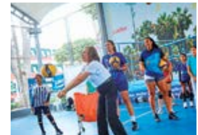
Alcaldesa Malca Schnaiderman, promoviendo el deporte, para tener nuevos valores nacionales.