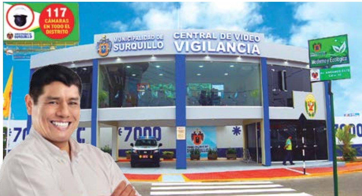
Continuará con el fortalecimiento de la Seguridad Ciudadana. En lo disuasivo, instalará nuevas cámaras (con reconocimiento facial y de placas de vehículos e inteligencia artificial), en todas las calles e intersecciones del distrito.

Fortalecimiento de la Seguridad Ciudadana, colocando cámaras en todas las calles del distrito, Reabrir los mercados y hacerlo Mercados Modelo, Construir La Casa de La Familia y continuar con la modernización del distrito.