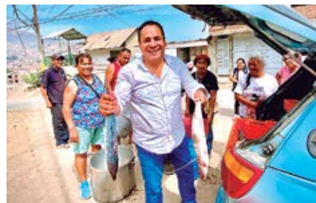
Como empresario, el apoyo alimentario permanente se viene dando a través de campañas solidarias.

la alcaldía y, para muchos, representa una opción real de futuro para hacer de Comas un distrito moderno. Su propuesta es clara: renovar Comas con orden y honestidad, construyendo un distrito más seguro, limpio y organizado y fortaleciendo al empresariado local como motor del empleo, la economía y el desarrollo. Jean Paul apuesta por un Co-