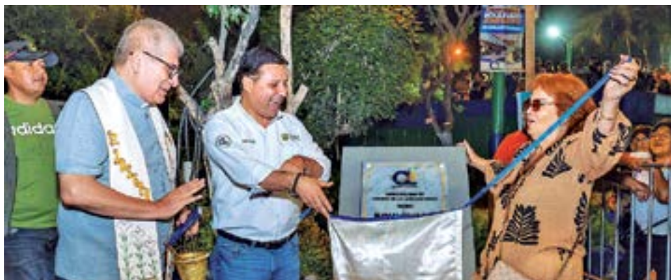
Alcalde Edwards Infante develando la placa del Bulevar José Gálvez junto al párroco y la madrina.

Con gran éxito, se inauguró el Bulevar José Gálvez, una obra largamente esperada por los vecinos del distrito, que comprende el tramo del Jr. José Gálvez, cuadras 1 y 2, entre las avenidas Vicente Morales Duárez y Primero de Mayo. Esta intervención se desarrolla en una zona estratégica, cercana a la principal vía de acceso al Aeropuerto Internacional Jorge Chávez, contribuyendo a dinamizar la actividad económica local y fortalecer la integración urbana. El proyecto incluyó la implementación de nuevos pisos de concreto y adoquines, veredas estampadas, iluminación LED, mobiliario urbano como bancas y pérgolas, juegos infantiles, murales, áreas verdes con vegetación nativa, puntos ecológicos y un pórtico de ingreso iluminado, consolidando un espacio