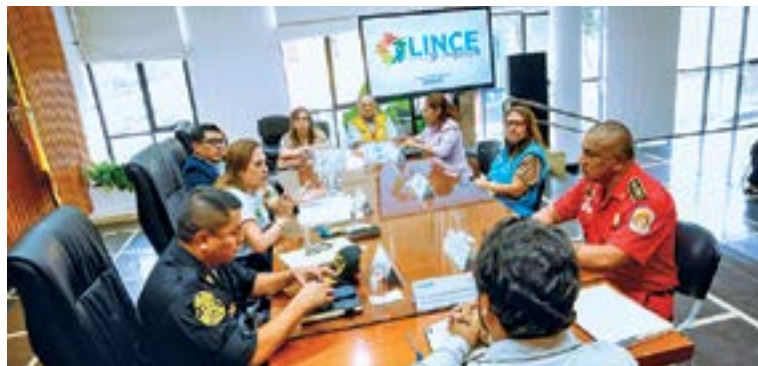
Fortaleciendo la seguridad ciudadana, para tener un distrito más seguro y ordenado.

En el marco del Día Mundial de la Lucha contra la Depresión, se desarrolló una campaña de salud integral en la Plaza Pedro Ruiz Gallo, brindando más de 1,100 atenciones gratuitas en psicología, psiquiatría y medicina general. Esta iniciativa reforzó el trabajo sostenido del Centro de Salud Mental Comunitario de Lince, que desde el 2025 ha superado las 4,600 atenciones gratuitas.