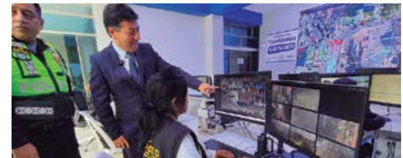
Central de Video Vigilancia operativo las 24 horas