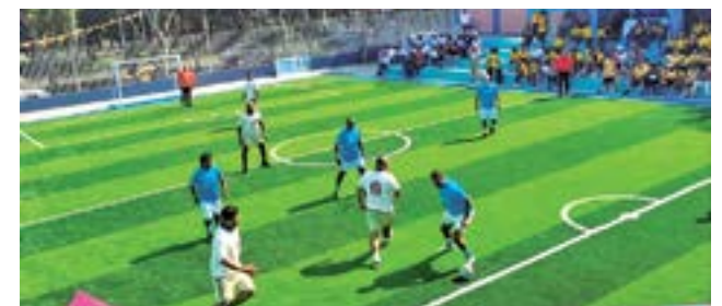
En su reapertura, se dio un partido de exhibición con reconocidas exfiguras del fútbol peruano.