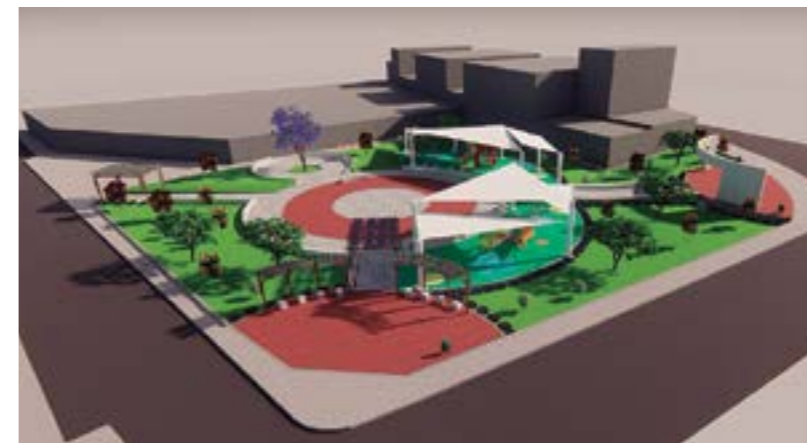
Parque La Familia en ejecución - ex SiSol (Vista en 3d).