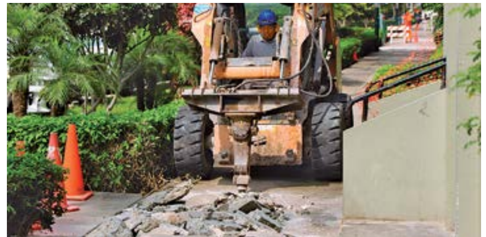
El alcalde Jesús Gálvez, cumpliendo su compromiso de mejorar los parques, el ornato y el mobiliario urbano ya inició la ejecución de estas obras y continuará con otros sectores vecinales.