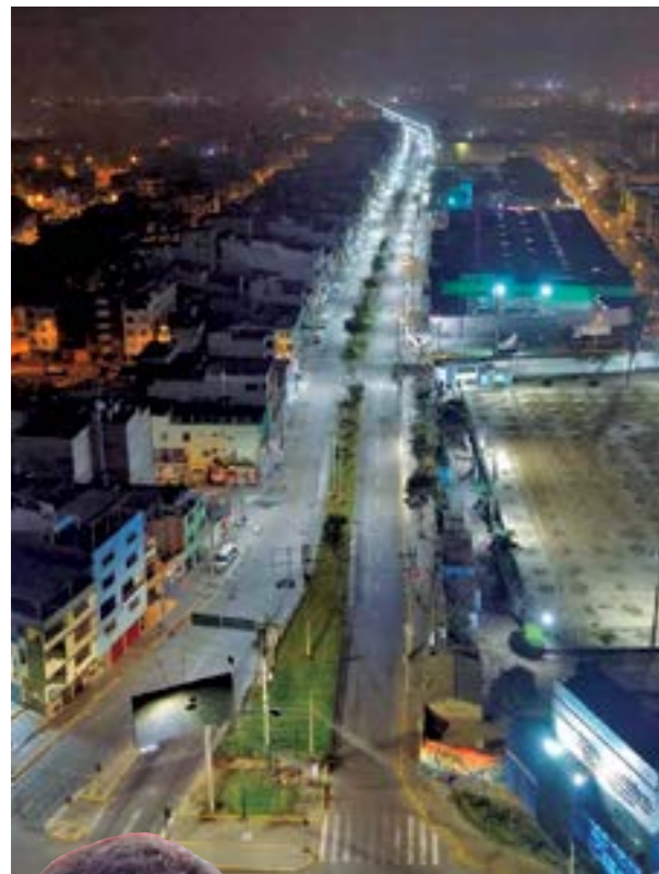
Instalación de luminarias LED en la avenida Ancash.