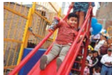
Parque Las Nazarenas en A.H. El Independiente.