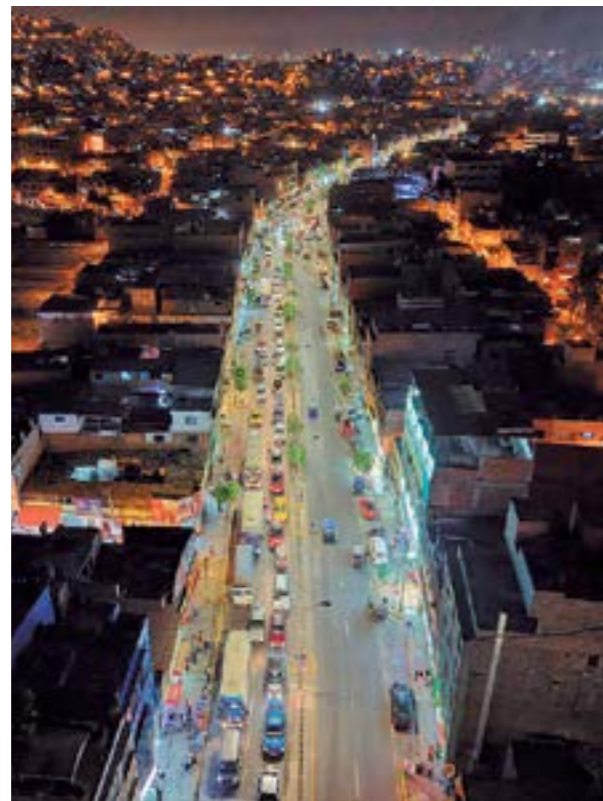
Instalación de luminarias LED en la avenida Riva Agüero.