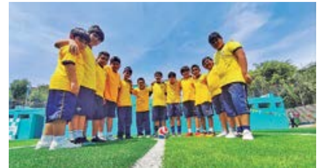
Los niños son los más entusiasmados en la participación del deporte y la municipalidad viene brindando la atención necesaria.

tegración vecinal y promover estilos de vida saludables. "El deporte es una herramienta de transformación social y una oportunidad para impulsar el talento de nuestros niños y jóvenes", señaló. Con esta actividad, la municipalidad buscó consolidar al distrito como un espacio activo en la promoción del deporte y la convivencia ciudadana.