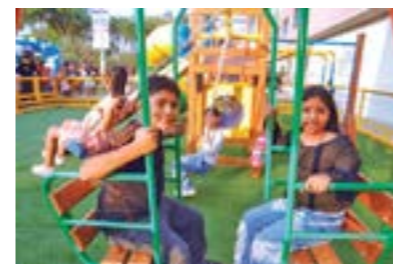
Parque Los Jardines, al servicio de las familias del distrito.