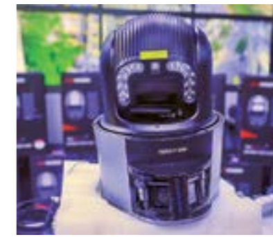
Modernas cámaras con inteligencia artificial.