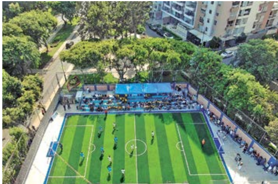
Se reabrió el campo sintético del Complejo Deportivo Mariscal Ramón Castilla, para el disfrute de los niños, jóvenes, adultos y familias del distrito.