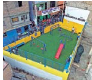
Nuevo Parque Infantil San Pedro de Ate, nuevos juegos infantiles e iluminación.