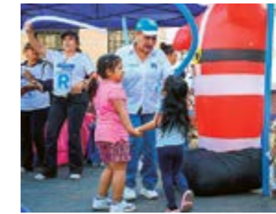
Apoyo permanente a la niñez, jóvenes, mujer, adulto mayor y discapacitados.