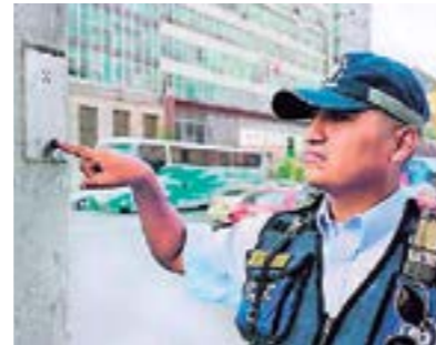
Instalación de Botones Pánico en diferentes sectores del distrito.