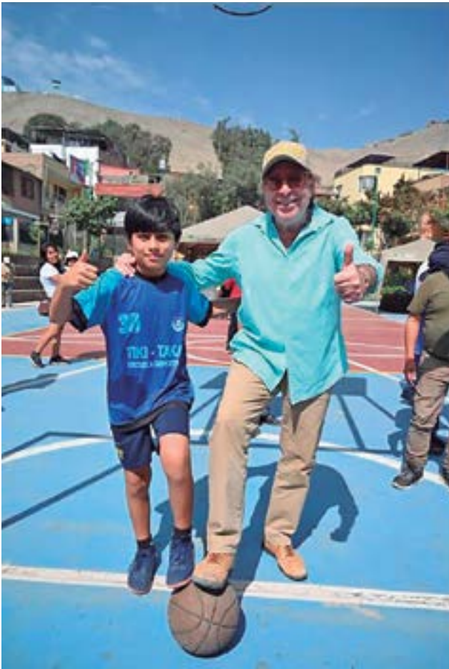
Nuevas losas deportivas, renovación de parques y la inauguración de la moderna sede de Gestión de Riesgos de Desastre, donde se concentra todas las capacidades técnicas, operativas y estratégicas, formaron parte de las obras recientemente entregadas.