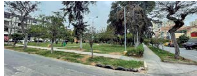
Mejoramiento y Recuperación de parques y jardines.