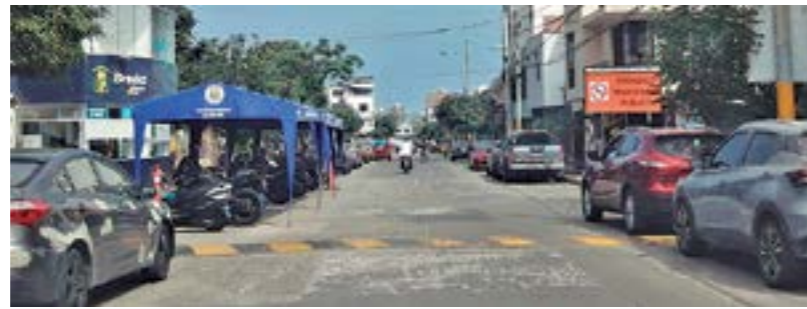
Mejoramiento de las vías metropolitanas con el apoyo de la Municipalidad de Lima y las calles, avenidas y jirones internas mediante gestión para su financiamiento ante el Gobierno, entre otras.