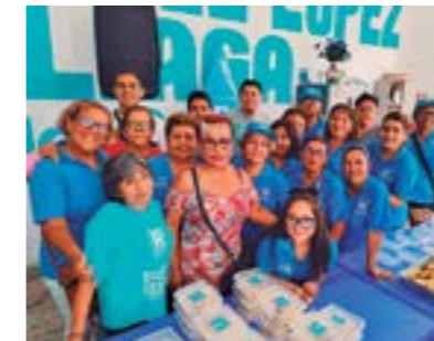
Instalación de más Comedores Populares Renovadores para los vecinos.