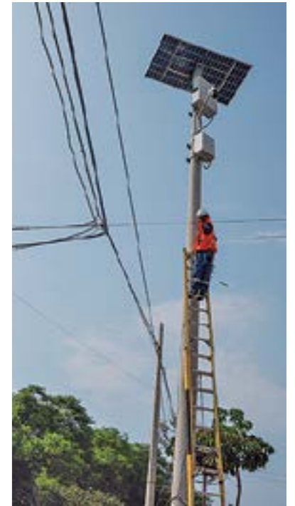
Instalación de cámaras de video vigilancia en puntos críticos.