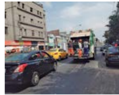
Mejoramiento del servicio de Limpieza Pública.