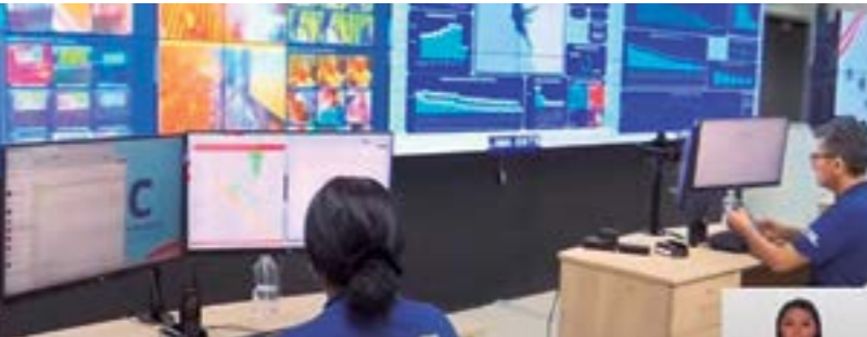
Instalación de una moderna central de video vigilancia que esté conectado a la Línea de Emergencia 105 de la PNP.