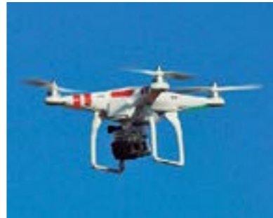
Drones con cámaras para patrullar puntos del distrito y momentos críticos.